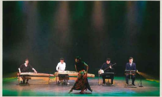
過去の公演よりコンテンポラリーダンサーとのコラボの様子

演奏を披露するのは、若き邦楽演奏家“邦楽ソリスデン”のメンバーたち。今やそれぞれ国内外で活躍を続けるメンバーですが、宇都宮で共に切磋琢磨しながら育った仲間でもあります!そんな4人が織りなす魂の「SANKYOKU」を、ぜひ体感してください!